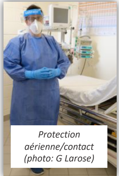
Protection aérienne/contact